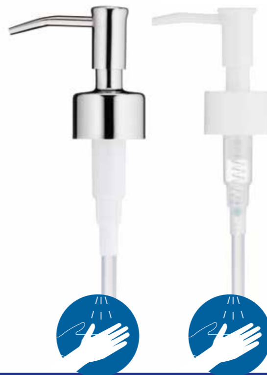
Edelstahl 24500 ABS-Kunststoff 24504

In der kela-Kollektion finden Sie mehr als 80 verschiedene Seifenspender in verschiedenen Materialien, Designs und Ausführungen.