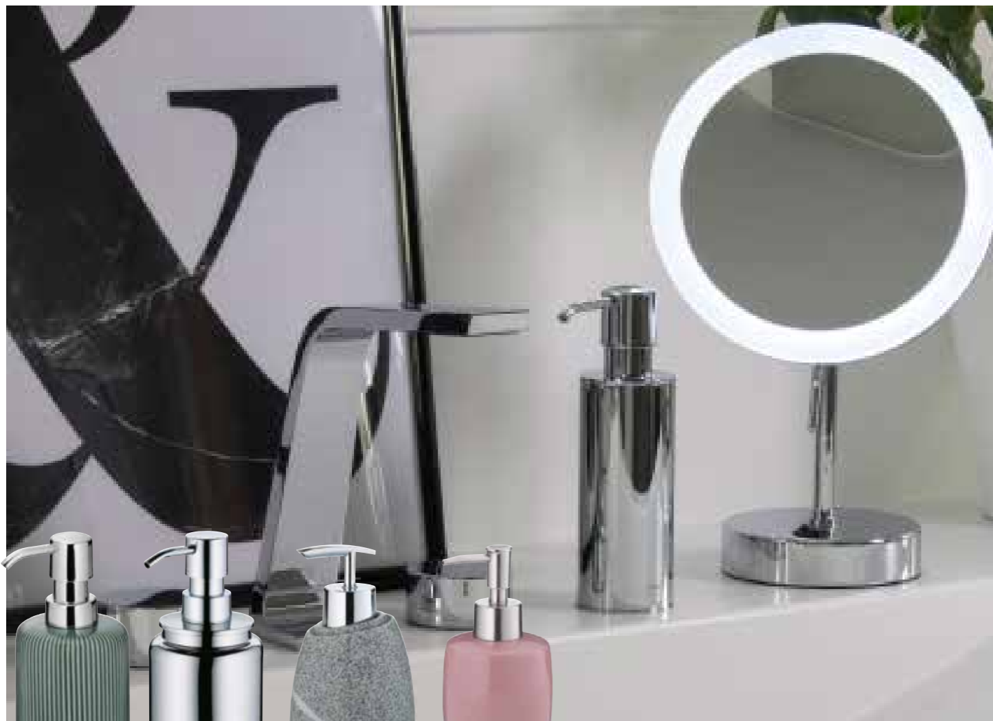
Die Messig-Serie Brass kann für Seife oder Desinfektionsmittel verwendet werden. Ava 24417 Faber 22842 Talus 20257 Lindano 20333